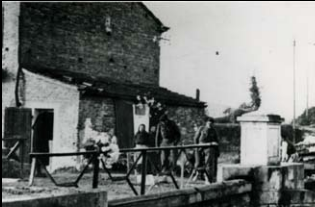
Il Ponte degli Allocchi subito dopo la liberazione.